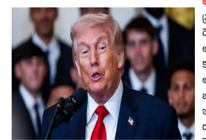
అవకాశాల్ని ట్రంప్ పరిశీలిస్తున్నట్లు తెలుస్తోంది. తాజా పరిణామాలపై ట్రంప్ మాట్లాడారు. అమెరికాలో ఒప్పందానికి ఇరాన్ ప్రాధేయపడుతోందని ట్రంప్ అన్నారు. ప్రస్తుతం దౌత్యపరమైన చర్చల అంతం ఇంకా కాలిఫోర్నియాలో, ఇరాన్ అమెరికాలో ఒప్పందం కోసం ప్రయత్నిస్తోందన్నారు. ఇరాన్ మిలిటరీ కోలుకునే అవకాశమే లేదని, కానీ, వారు చర్చల ప్రతిపాదనలు వింటే, ఆశ్చర్యకరంగా ఉన్నాయన్నారు. "ఇరాన్ ప్రతినిధులు అమెరికా ప్రతిపాదన కోసం ఎదురుచూస్తున్నట్లు చెప్పకొంటున్నారు. వారు తప్పు చేస్తున్నారు. చర్చల అంతం మరి అలసత్వం కాకముందే మేల్కోవడం మంచిది. ఇంకా ఆసన్నమైతే మంచిదికాదు."

అమెరికా: అమెరికా, ఇరాన్ మధ్య చర్చల ప్రతిపాదన వచ్చిన సంగతి తెలిసిందే. ఇరు దేశాలు తమ షరతుల్ని ప్రకటించాయి. అయినప్పటికీ, ఇంకా చర్చలు ముందుకు కదలడం లేదు. ఈ నేపథ్యంలో అమెరికా అధ్యక్షుడు ట్రంప్, ఇరాన్ కు కీలక హెచ్చరిక జారీ చేశారు. దౌత్యపరమైన చర్చలు విఫలమైతే ఇరాన్ పై మరింత భారీ సైనిక దాడులుంటాయని హెచ్చరించారు. ఈ మేరకు సైనికపరంగా దాడి చేసేందుకు ఉన్న అవకాశాల్ని ట్రంప్ పరిశీలిస్తున్నట్లు తెలుస్తోంది. తాజా పరిణామాలపై ట్రంప్ మాట్లాడారు. అమెరికాలో ఒప్పందానికి ఇరాన్ ప్రాధేయపడుతోందని ట్రంప్ అన్నారు. ప్రస్తుతం దౌత్యపరమైన చర్చల అంతం ఇంకా కాలిఫోర్నియాలో, ఇరాన్ అమెరికాలో ఒప్పందం కోసం ప్రయత్నిస్తోందన్నారు. ఇరాన్ మిలిటరీ కోలుకునే అవకాశమే లేదని, కానీ, వారు చర్చల ప్రతిపాదనలు వింటే, ఆశ్చర్యకరంగా ఉన్నాయన్నారు. "ఇరాన్ ప్రతినిధులు అమెరికా ప్రతిపాదన కోసం ఎదురుచూస్తున్నట్లు చెప్పకొంటున్నారు. వారు తప్పు చేస్తున్నారు. చర్చల అంతం మరి అలసత్వం కాకముందే మేల్కోవడం మంచిది. ఇంకా ఆసన్నమైతే మంచిదికాదు."