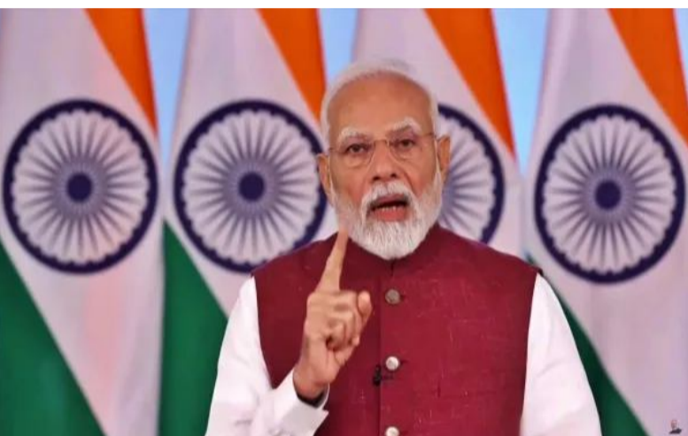
అంతకంతకూ పెరుగుతోంది. నాలుగు వారాలుగా దాడులు

న్యూఢిల్లీ : పశ్చిమాసియాలో యుద్ధం కొనసాగుతూనే ఉంది.. ఆ ప్రభావం ప్రపంచదేశాలలో పాటుగా భారత్ పై పడుతోంది. ఈ మేరకు భారత్ లో ఇంధన కారత నేపథ్యంలో అన్ని రాష్ట్రాల ముఖ్యమంత్రులతో ప్రధాని మోదీ మార్చి 27న సాయంత్రం 6 గంటల 30 నిమిషాలకు కీలక సమావేశం నిర్వహించనున్నారు. దిల్లీలోని తన అధికారిక నివాసం నుంచి వీడియో కాన్ఫరెన్స్ నిర్వహించారు. ఇక రెండు రోజుల క్రితం త్రివిధ దళాధిపతులతో కేంద్రం సమావేశం నిర్వహించిన విషయం తెలిసిందే. అలాగే నిన్న అఖిలపక్ష భేటీ నిర్వహించారు. మరోవైపు రేపు అన్ని రాష్ట్రాల సీఎంలతో ప్రధాని మోదీ భేటీ నేపథ్యంలో దేశవ్యాప్తంగా ప్రాధాన్యం సంతరించుకుంది. పశ్చిమాసియాలో ఉద్రిక్త పరిస్థితులు ఏమాత్రం తగ్గడం లేదు. ఇరాన్-ఇజ్రాయేల్-అమెరికా మధ్య యుద్ధం