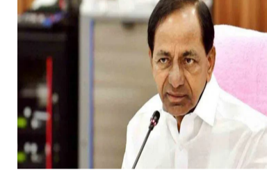
అన్యోన్యంగా ప్రతికంగా శ్రీ సీతారాముల కల్యాణ మహోత్సవం నిలుస్తుందని గులాబీ అధినేత అన్నారు. విజన్ భారతీయ సాంస్కృతిక సామాజిక కుటుంబ జీవన గమనంలో సంప్రదాయాలు, విలువలు, ధర్మానికి ప్రాధాన్యమిస్తూ సాగిన సీతారాముల భార్య ధర్మల బంధానికి బిందూ మల సాంప్రదాయంలో పవిత్రమైన స్నానం ఉన్నదని రేవంత్ అన్నారు. పలు కష్టాలు, త్యాగాలతో కాలపరీక్షకు ఎదురొడ్డి నిలిచిన సీతారాముల ప్రేమ బంధం అజరామరం, ఆదర్శనియం అని రేవంత్ తెలిపారు. రాష్ట్రం సుఖిష్టంగా వర్ధిల్లే, ప్రజలంతా సుఖ శాంతులతో జీవించేలా శ్రీ సీతారాముల చల్లని దీపెనలు రాష్ట్ర ప్రజలకు అందాలని రేవంత్ ప్రార్థించారు.

హైదరాబాద్: శ్రీరామ నవమి సందర్భంగా రాష్ట్ర ప్రజలకు తెలంగాణ తొలి ముఖ్యమంత్రి, బీఆర్ఎస్ అధినేత రేవంత్ శుభాకాంక్షలు తెలిపారు. హిందువుల ఆరాధ్య దైవమైన శ్రీరాముడు, జగన్మాత సీతాదేవిని వివాహమాడే వర్షాది సముగా శ్రీరామ నవమిని జరుప గుంటూరులో కేసీఆర్ తెలిపారు. వివాహం అనే పవిత్ర బంధంతో ఒక్కటయ్యే ఆలు మగల అన్యోన్యంగా ప్రతికంగా శ్రీ సీతారాముల కల్యాణ మహోత్సవం నిలుస్తుందని గులాబీ అధినేత అన్నారు. విజన్ భారతీయ సాంస్కృతిక సామాజిక కుటుంబ జీవన గమనంలో సంప్రదాయాలు, విలువలు, ధర్మానికి ప్రాధాన్యమిస్తూ సాగిన సీతారాముల భార్య ధర్మల బంధానికి బిందూ మల సాంప్రదాయంలో పవిత్రమైన స్నానం ఉన్నదని రేవంత్ అన్నారు. పలు కష్టాలు, త్యాగాలతో కాలపరీక్షకు ఎదురొడ్డి నిలిచిన సీతారాముల ప్రేమ బంధం అజరామరం, ఆదర్శనియం అని రేవంత్ తెలిపారు. రాష్ట్రం సుఖిష్టంగా వర్ధిల్లే, ప్రజలంతా సుఖ శాంతులతో జీవించేలా శ్రీ సీతారాముల చల్లని దీపెనలు రాష్ట్ర ప్రజలకు అందాలని రేవంత్ ప్రార్థించారు.