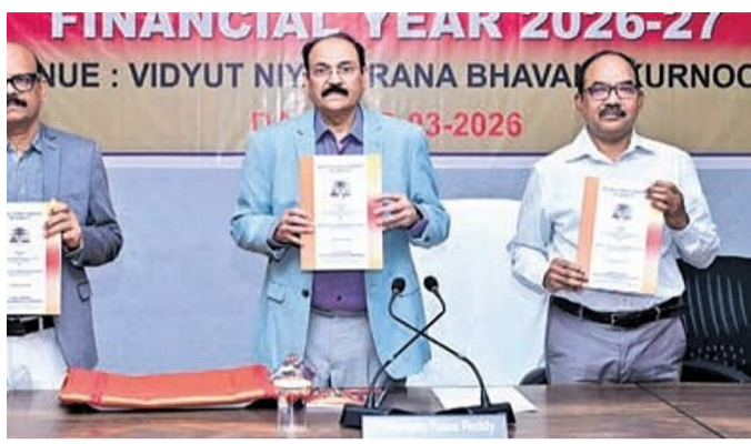
APERC Chairman PVR Reddy (center) and officials holding a document during a press conference.

from Scheduled Castes, Scheduled Tribes, and economically weaker sections will receive power either free or at concessional rates Transfer (DBT). In a significant relief to commercial users, tariffs have been redpower either free or at concessional rates through Direct Benefit Transfer (DBT). The Commission has also increased the load limit for cottage industries from 10 HP to 20 HP, extending concessional tariffs to around 18,000 such consumers. APERC Chairman also announced several structural changes, including the creation of a separate tariff category for solar module manufacturing industries to promote renewable energy. Certain sectors like water purification plants and printing press units have been reclassified under the industrial category. The Commission rejected key proposals from DISCOMs, including changes to Time-of-Day tariffs and removal of the green power category. It also directed DISCOMs to improve efficiency, reduce arrears, and enhance electrical safety measures across the state.