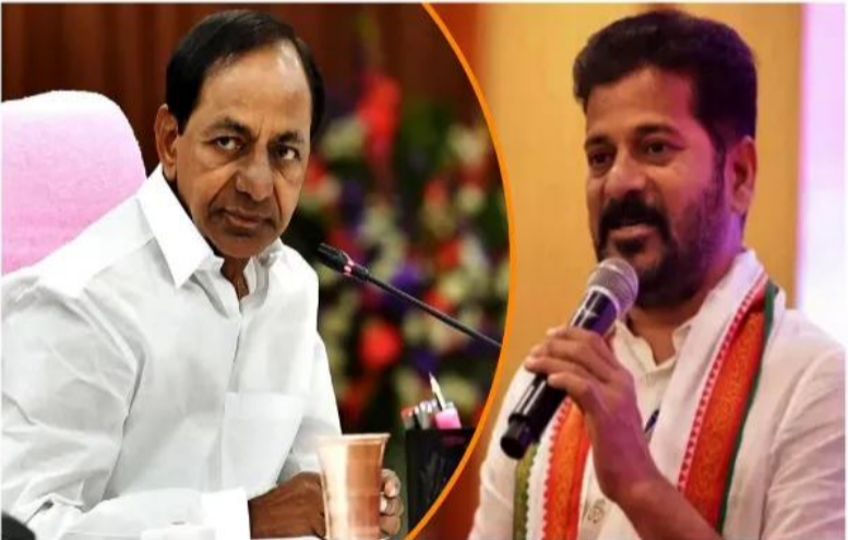
అసెంబ్లీ స్థానాలు మరో 60 పెరిగి 179కి చేరుకునే అవకాశం నియోజకవర్గాలు ఏర్పాటు ఖాటం ఖాయంగా చెబుతున్నారు.

హైదరాబాద్: తెలంగాణ రాజకీయాల్లో కీలక మలుపు, లోక సభ - అసెంబ్లీ స్థానాల పునర్విభజన రాష్ట్ర రాజకీయ స్వరూపాన్నే మార్చేస్తోంది. కేంద్ర తాజా నిర్ణయం సవలనంగా మారుతోంది. ప్రస్తుతం రాష్ట్ర లో ఉన్న ఎంపీ- ఎమ్మెల్యే స్థానాలు ఛార్జీ గా పేరగను న్నాయి. ప్రతి జిల్లాలో ప్రస్తుతం ఉన్న అసెంబ్లీ స్థానాలు 50 శాతం మేర పెంచేందుకు రంగం సిద్ధమైంది. కొత్త నియోజకవర్గాల పైనా దాదాపు సుష్టత వస్తోంది. అయితే, రాజకీయంగా కఠినావు లెక్కలు మాత్రం అసక్తి కరంగా ఉన్నాయి. తెలంగాణలో ఎన్నికలు 2028 కాదు. 2029 లోనే జరిగే అవకాశాలు ఉన్నాయి. కేంద్రం తాజా గా ఎంపీ- ఎమ్మెల్యే స్థానాలు 50 శాతం మేర పెంచుతూ... మహిళా రిజర్వేషన్ అమలు చేసేటా కసరత్తు వేగవంతం చేసింది. అందులో భాగంగా తెలంగాణలో ఎమ్మెల్యే, ఎంపీ సీట్ల సంఖ్య గణనీయంగా పెరగనున్నాయి. తెలంగాణలో ఉన్న 119