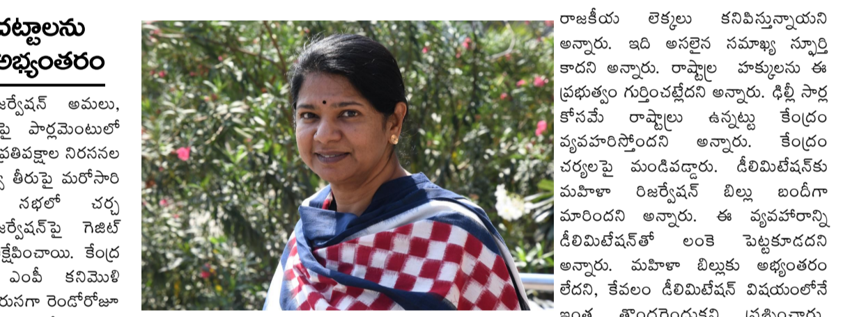
ఈ సందర్భంగా కనిమొళి అన్నారు. రోజుల వ్యవధిలో కావాలంటే ఉన్న సీట్లతోనే మహిళా రిజర్వేషన్లు బిల్లులు ఆమోదించేసుకోవాలనే ప్రయత్నంలో అమలు చేయాలన్నారు.

సూర్యశ్రీ, ఏప్రిల్ 17: మహిళా రిజర్వేషన్ అమలు, లోక్ సభ సీట్ల పెంపు బిల్లులపై పార్లమెంటులో రెండోరోజూ చర్చ ప్రారంభమైంది. ప్రతిపక్షాల నిరసనల నడుమ నభ సాగుతోంది. ప్రభుత్వ తీరుపై మరోసారి ప్రతిపక్షాలు మండిపడ్డాయి. నభలో చర్చ జరుగుతుండగా మహిళా రిజర్వేషన్ పై గెజిట్ నోటిఫికేషన్ విడుదల చేశారని ఆక్షేపించాయి. కేంద్ర ప్రభుత్వం తీరుపై డీఎంకె ఎంపీ కనిమొళి మండిపడ్డారు. డిఎంకె ఎంపిలు వరుసగా రెండోరోజూ నల్లదుస్తులతో సభకు హాజరయ్యారు. హోం మంత్రి అమిత్ షా మోతం లేని సమాధానాలు చెబుతున్నారని