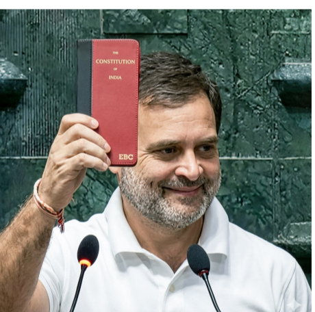
త్తం చేసేవిగా లేవని రాహుల్ అన్నారు. కేవలం తన వైఖరాలను కప్పిపుచ్చుకునే ప్రయత్నమని అన్నారు.

చేశారు. ఆదివారం సికింద్రాబాద్ లోని పరేడ్ గ్రౌండ్ లో బీజేపీ భారీ బహిరంగ సభ నిర్వహించింది. ఈ బహిరంగ సభలో ప్రధాని నరేంద్ర మోదీ మాట్లాడుతూ.. పశ్చిమాసియా యుద్ధ ప్రభావం దేశంపై తీవ్రంగా ఉందని అన్నారు. ప్రపంచవ్యాప్తంగా పెట్రోల్, డీజిల్, గ్యాస్, యూరియా ధరలు అమాంతం పెరిగాయని తెలిపారు. రెండు నెలల నుంచి ప్రజలపై భారం పడకుండా అన్ని చర్యలు తీసుకుంటున్నామని, యుద్ధం కారణంగా పచ్చే సప్లై కేంద్రమే భరిస్తోందని వెల్లడించారు. క్షిప్ర సమయంలో దేశ ప్రజలు పెట్రోల్, డీజిల్ పరిమితంగా వినియోగించాలని కోరారు. ప్రజలు ఎలక్ట్రిక్ వాహనాలను వినియోగించాలని.. వర్చువేమ్ హోమ్, ఆన్లైన్ మీటింగ్ గిలు పెట్టుకోవాలని విజ్ఞప్తి చేశారు. ప్రజా రవాణాను వినియోగించాలన్నారు. ఇవన్నీ కూడా ప్రజలను అప్రమ