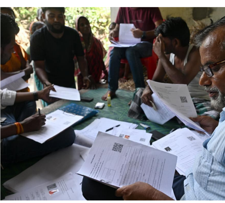
సాంకేతికతను ఉపయోగించడం లేదు. ఓటరు తమ అడ్రెస్ ను మార్చుకునే వెసులబాటు ఉండాలి. ఆధార్, పాన్ నంబర్ లింక్ అయితే సమస్య రాదు. తాము జీవింపి ఉన్నామని నిరూపించుకునే ఆన్లైన్ వెసులు బాటు కల్పించగలిగితే మరీ మంచిది. బ్యాంకు ఖాతా, పాన్ కార్డులను ఆధార్ తో అనుసంధానం చేసినట్లు, ఓటరు కార్డు కూడా ఆధార్ తో అనుసంధానం చేయడం ద్వారా దొంగ

అనేది రాజ్యాంగం ప్రతి పౌరుడికీ కల్పించిన హక్కు. అది ప్రతి ఒక్కరికీ అవసరం. ప్రజాస్వామ్యంలో ఓటర్ గా సమాధులు చేసుకోవడం బాధ్యత. ఓటు వేయడం కూడా అంతే బాధ్యతగానే భావించాలి. కానీ రాజకీయ పార్టీలకు తమ బోగస్ ఓట్లు తొలగి పోతాయన్న భయం పట్టుకుంది. బెంగాల్, బాహార్ లో చొరబాటుదారులను ఓటర్లు చేర్చారు. అలా లక్షల్లో ఓట్లు చేరిపోయాయి. అందుకే ఎన్నికల సంఘం నిర్దాక్షిణ్యంగా వాటిని తొలగించింది. దీంతో ఆయా రాష్ట్రాల్లో నేతలు లబ్ధిదోషమన్నారు. అర్జులు అనర్హులవటం, లేక ఇప్పుడు అనర్హులు భవిష్యత్తులో అర్హులవటం జరగగలదు. ఓటరు మరణించినప్పుడు వాటిని తొలగించాలి. అలాగే అనర్హులు లేదా ఇతర దేశీయులు ఉన్నప్పుడు కూడా వాటిని తొలగించాలి. అందుకే సర్ ప్రక్రియ అదే పనిచేస్తుంది. మరొక కారణం ఒక మనిషి పేరుమీద రెండు ఓట్లు ఉన్నప్పుడు. కూడా తొలగించడం సరైన చర్యనే. ఉమ్మడి ఎపిలో ఆంధ్రప్రదేశ్ లో తెలంగాణలో కూడా ఓట్లు ఉండేవి. రెండు విధతల ఎన్నికలు జరిగినప్పుడు ఇక్కడా, అక్కడా ఓటిసిన సందర్భాలు కోట్లాది. ఇలాంటి సహజమైన కారణాలుగా గుర్తించి తొలగించాల్సి ఉంటుంది. వీటిమీద ఎవరికీ అభ్యంతరం వుండకూడదు. రాజకీయ పార్టీలు ఇలాంటి వారి విషయంలో సమాచారం అందజేయాలి. ఇటీవల ఎన్నికల సంఘం ఒక్క బెంగాల్ లో 90 లక్షల మందిని ఓటరు జాబితా నుంచి తొలగించింది. ఇందులో బంగ్లా నుంచి దొంగపాటుగా వచ్చిన వారి 90శాతం మంది ఉన్నారు. ఒక వ్యక్తికి ఒకటే ఆధార్ కార్డు, ఒకే పాన్ కార్డు, ఒకే పాన్ పోర్ట్ ఉంటుంది. వారి ఆధునిక సాంకేతిక పరిజ్ఞానం వాటి, ఒక మనిషికి ఒకే ఓటు ఉండేలా చేయటం సాధ్యం అయ్యేదా అయినా ఎన్నికల సంఘం ఆధునిక