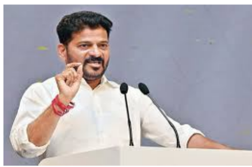
రూ.1011 కోట్లతో క్యూర్ ప్రాంతంలో నిర్మించే యంగ్ ఇండియా ఇంటిగ్రేటెడ్ స్కూల్స్ కు సీఎం శంకుస్థాపన చేశారు.

హైదరాబాద్, మే 11 : తెలంగాణలో నూతన విద్యావిధానాన్ని అమలు చేస్తామని ముఖ్యమంత్రి రేవంత్ రెడ్డి వ్యాఖ్యానించారు. ప్రభుత్వ విద్యలో తెలంగాణను దేశంలోనే సంబర్ధనగా నిలబెట్టడమే తమ లక్ష్యమని ఉద్ఘాటించారు. దేశానికి ఆదర్శంగా నూతన విద్యావిధానం ఉండాలన్నదే తమ ప్రయత్నమని తెలిపారు. ప్రభుత్వ పాఠశాలల్లో ఈ విద్యా సంవత్సరం నుంచి నర్సరీ నుంచి 12వ తరగతి వరకు ప్రవేశపెడుతున్నామని వివరించారు. పదో తరగతి పాస్ అయిన తర్వాత ఇంటర్ లో డ్రాఫ్ట్ చేసి పెరుగుతున్నాయని తెలిపారు. దేశ భవిష్యత్తు తరగతి గదుల్లోనే ఉంచిన పేర్కొన్నారు. ఈ రోజు (సోమవారం)