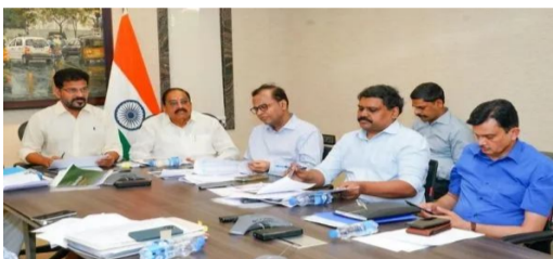
ఉంచని కాంట్రాక్టర్లపై అవసరమైతే క్రిమినల్ కేసులు నమోదు చేయాలని రవాణా శాఖను ఆదేశించారు. కారీల కొరత ఉంటే స్థానికంగా ట్రాక్టర్లను వినియోగించి చుక్కానాని సూచించారు. వివిధ ప్రాంతాల్లో గోడౌన్స్ సమస్య ఉన్నట్లు

హైదరాబాద్, మే 12 : రాష్ట్రంలో ధాన్యం సేకరణ, మొక్కజొన్న కొనుగోళ్ల ప్రక్రియపై ముఖ్యమంత్రి ఎ. రేవంత్ రెడ్డి జిల్లా కలెక్టర్లకు గట్టి హెచ్చరికలు జారీ చేశారు. మంగళవారం ముఖ్యమంత్రి క్యాంపు కార్యాలయం నుంచి కలెక్టర్లతో నిర్వహించిన వీడియో కాన్ఫరెన్స్లో ఆయన మాట్లాడుతూ.. ధాన్యం కొనుగోళ్లలో నిర్లక్ష్యాన్ని ఏమాత్రం సహించబోమని, రైతులు ఎక్కడా ఇబ్బంది పడకుండా మిషన్ మోడ్లో సేకరణ పూర్తి చేయాలని ఆదేశించారు. ధాన్యం సేకరణలో జాప్యం జరిగితే జిల్లా కలెక్టర్లపై బాధ్యులను చేపామని, అవసరమైతే చర్యలు తీసుకుంటున్నామని వెనకాడబోమని సీఎం స్పష్టం చేశారు. కాసుగోలు కేంద్రాల్లో గన్నె బ్యాగులు, హమాల్ ల కారత ఉండకూడదని, ధాన్యం లోడింగ్ లాల్లను అదుబాలుతో