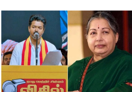
కూర్చున్నారు. ఆ తర్వాత ఐశ్వర్య రజనీకాంత్ కూడా చిరయాన్ విక్రమ్ ను అనుసరించి విజయ్ దగ్గరికి వెళ్లి కూర్చున్నారు. అయితే ఈ అవమానంపై విజయ్ ఎలాంటి వ్యాఖ్యలు చేయలేదు. ఎవరని తప్పుపట్టలేదు. కానీ విజయ్ ని బహిరంగంగా అవమానించారని ఆయన అభిమానులు, శ్రేయోభిలాషులు విమర్శలు చేశారు. నటుడిగా ప్రజల అభిమానం చూరగని రాజకీయాల్లో ఎదిగిన ఎంజీఆర్ ను తమిళనాడు అప్పటికి చూసింది. జయలలిత కూడా

తమిళనాడు: అప్పుడు అంటే 2013లో నాటి జయలలిత సర్కారు నటుడు విజయ్ అవమానించింది. ఇప్పుడు అసెంబ్లీ ఎన్నికల్లో ఘన విజయం సాధించిన విజయ్ తమిళనాడు తనే స్వయంగా సర్కారును ఏర్పాటు చేశారు. కేవలం 13 ఏళ్లలో జరిగిన ఈ మార్పు విజయ్ అభిమానుల్లో అంతలేని సంతోషాన్ని నింపింది. 2013లో చెన్నైలో సినిమా శతాబ్ది ఉత్సవాలు జరిగాయి. ఈ ఉత్సవాలకు నాటి రాష్ట్రపతి ప్రణబ్ ముఖర్జీ తమిళనాడు ముఖ్యమంత్రి జయలలిత హాజరయ్యారు. వారితోపాటు ఆ రాష్ట్రానికి చెందిన ప్రముఖ నటీనటులు కూడా ఉత్సవాలకు విచ్చేశారు. వీశీబిఆవరమిళనాడు ప్రస్తుత ముఖ్యమంత్రి విజయ్ ని కూడా ఆ ఉత్సవాలకు ఆహ్వానించారు. అయితే నాటి జయలలిత సర్కారు విజయ్ కి ఉద్దేశపూర్వకంగా వెనుక వరుసలో సీటు కేటాయించింది. ఆయనకు తక్కువ పేరున్న నటుడు చిరయాన్ విక్రమ్తోపాటు పలువురికి ముందు వరుసలో సీట్లు ఇచ్చారు. విజయ్ వెనుక వరుసలో కూర్చుని ఉండటాన్ని గమనించిన చిరయాన్ విక్రమ్.. ముందు వరుస నుంచి వెనక్కి వెళ్లి విజయ్ వక్రన కూర్చున్నారు. అప్పటివరకు విజయ్ అక్కడ ఓటంబిగానే